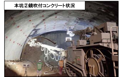
本坑②鏡吹付コンクリート状況