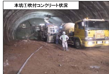
本坑①吹付コンクリート状況