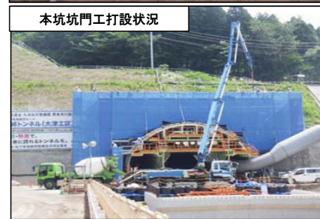
本坑坑門工打設状況